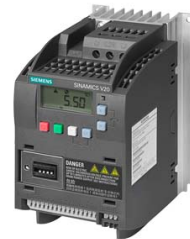
Figura similar Figure similar